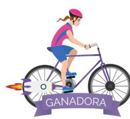
Fase 4 Selección de la ganadora para ir a Singularity University