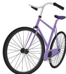
Fase 3 Selección de las 10 finalistas y proceso de mentoring para el desarrollo de proyectos