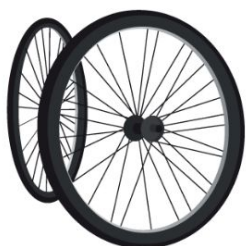
Fase 1 Convocatoria, postulación y selección de 50 emprendedoras