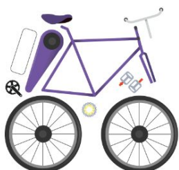
Fase 2 Academia de innovación para mujeres en STEM, que impulsa negocios con sentido